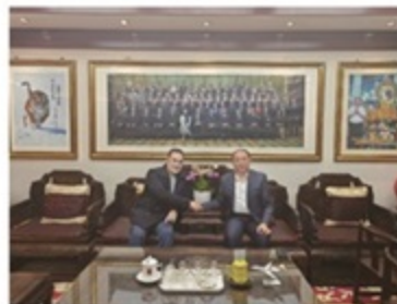
通讯员 恒运集团 刘亚楠

李长云主席表示航空领域具有广阔的应用前景，希望能与安部长继续探讨绿色航空、无人机技术、新能源、数字化和智能化以及航空安全等多方面发展趋势，共同推进航空事业的高质量发展。